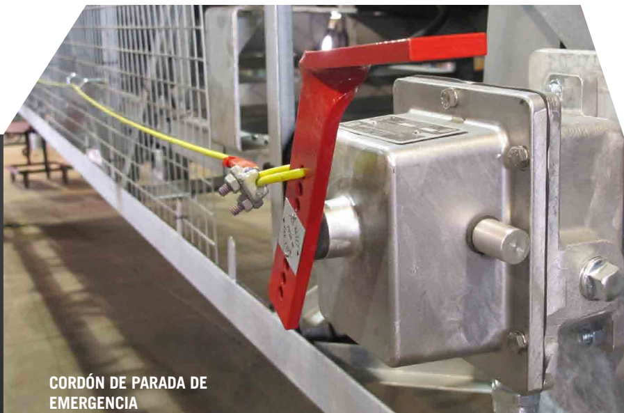
CORDÓN DE PARADA DE EMERGENCIA